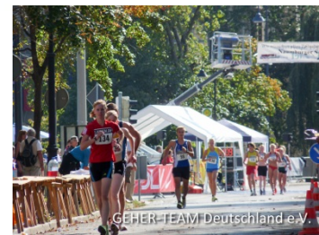
Über die 5km gingen 15 Geher an den Start