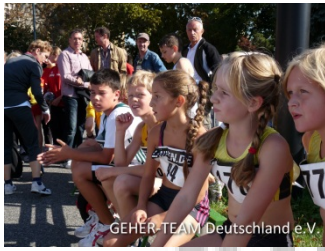
Der Nachwuchs nach den 1km

1:25:33h unterbot er seine erste 20km-Zeit, vom März, um fast viereinhalb Minuten. Er und seine Trainerin waren mit dem Ergebnis mehr als zufrieden.