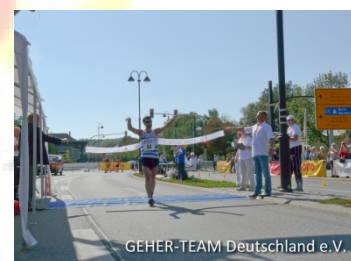
Jesús Ángel García aus Spanien gewinnt die 50km in 3:48:11h